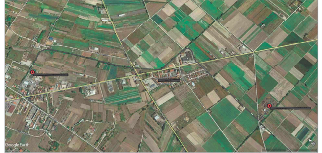
VISTA AEREA 1:1000